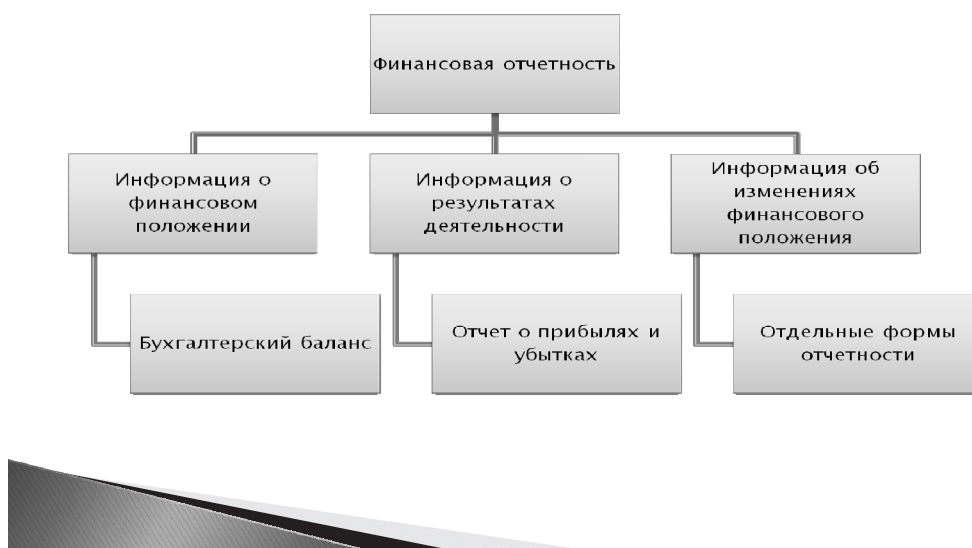
Рис. 1. Состав финансовой отчетности

Каждая форма отчетности представляет информацию, отличающуюся от других, но ни одна из них не дает всей информации, необходимой для конкретных нужд пользователей.