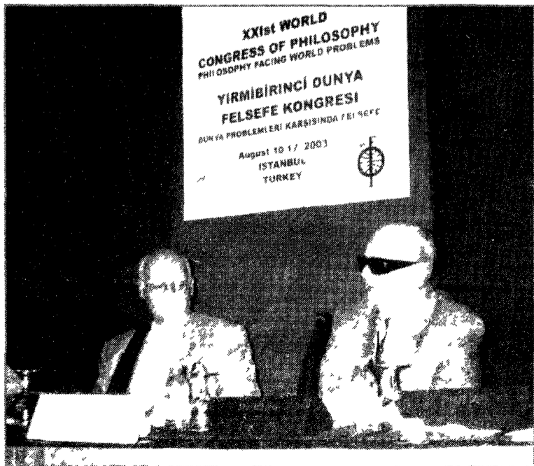
▲ За «круглым столом» с философом Гансом Ленном.

— Самые элементарные советы: не курить, пить в меру, держать в тонусе не только мышцы, но и мозг. И кстати, любить себя. Нет, эгоизм абсолютно ничего хорошего не несет. Но и альтруизм тоже. У Циолковского есть замечательные книги о разумном себялюбии. Оно не должно перерастать в эгоизм. Но отречение человека от самого себя ради других тоже не приветствуется. Нужна гармония интересов. Вещь непростая. А что касается диет и многочисленных систем — пробуйте. Но помните: что хорошо одному, другому — нет. А главное — быть оптимистом.